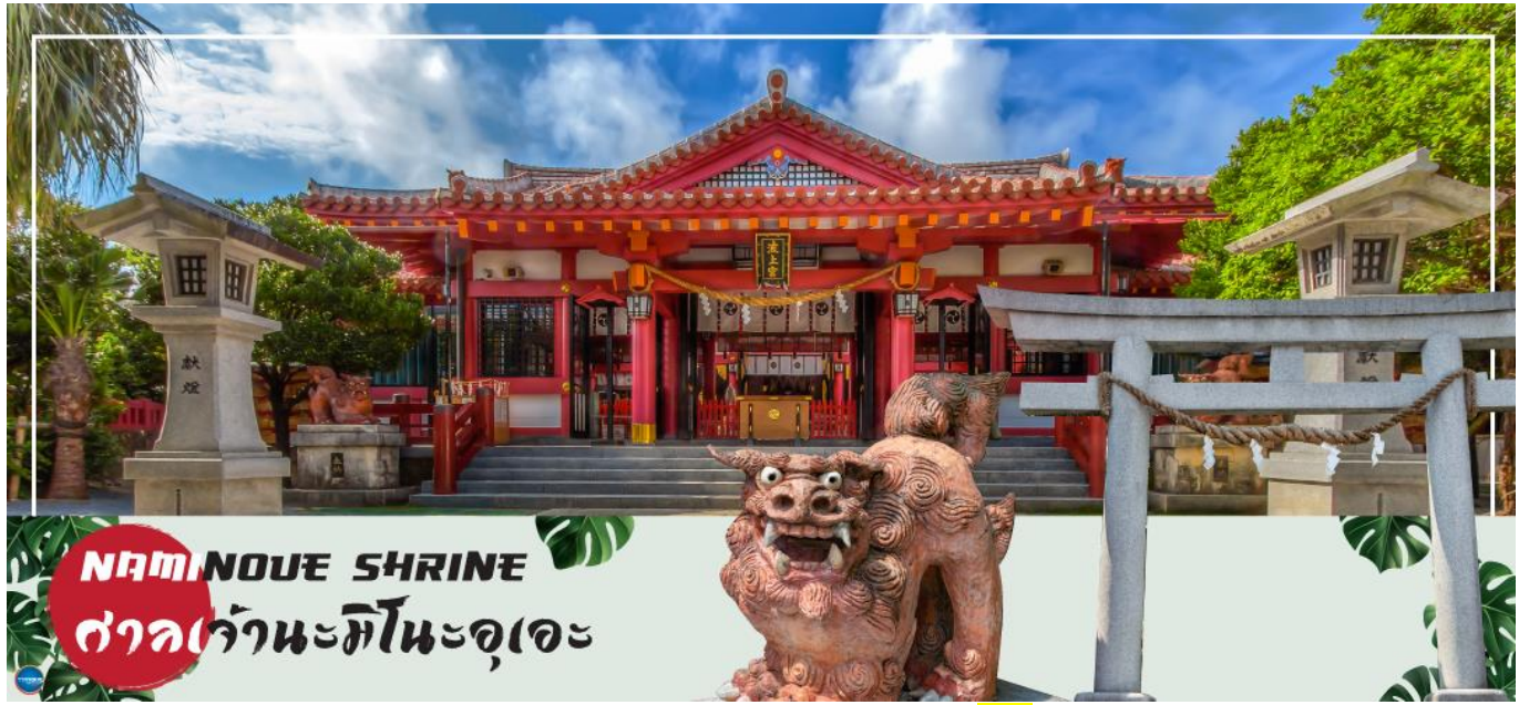
NAMINOUE SHRINE ศาลเจ้านะมิโนะอุเอะ

เช้า รับประทานอาหารเช้า ณ ห้องอาหารของโรงแรม (5) นำท่านเดินทางสู่ ศาลเจ้านะมิโนะอุเอะ (Naminoue Shrine) (ใช้เวลาเดินทางประมาณ 10 นาที) ตั้งอยู่ ณ บริเวณที่เป็นพื้นที่ศักดิ์สิทธิ์ที่ใช้ในการสวดภาวนาอธิษฐานต่อเทพเจ้าที่สถิตย์อยู่ ณ อาณาจักรเจ้าสมุทรโพ้นทะเลมาแต่ครั้งโบราณ ในอดีตชาวเรือที่เข้าออก ณ ท่าเรือนาสะ (Naha Port) ซึ่งขณะนั้นเป็นศูนย์กลางการแลกเปลี่ยนค้าขายกับนานาประเทศ ทั้งจีน ประเทศทางตอนใต้ เกาหลี และชวายามาโตะ มักจะแหงนหน้ามองขึ้นไปยังศาลเจ้าซึ่งตั้งอยู่บนหน้าผาสูงเพื่ออธิษฐาน และแสดงความขอบคุณ ศาลเจ้านามิโนะอุเอะได้รับความเสียหายจากการรบในโอกินาวะ (Battle of Okinawa) เมื่อครั้งสงครามแปซิฟิก แต่ได้รับการบูรณะฟื้นฟูในเวลาต่อมาเมื่อสงครามสิ้นสุดลง ปัจจุบันนี้ได้กลายมาเป็นศูนย์กลางแห่งศาสนาชินโตในจังหวัดโอกินาวะ ชาวญี่ปุ่นมักจะมาไหว้ขอพรเกี่ยวกับธุรกิจการงานให้เจริญรุ่งเรือง ร่ำรวย และมาสะเดาะเคราะห์ให้พ้นโชคร้าย จากนั้นนำท่านสู่ เอาท์เล็ตมอลล์ อาชิบิโน่า (Okinawa Outlet Mall Ashibinaa) (ใช้เวลาเดินทางประมาณ 30 นาที) เอาท์เล็ตแห่งแรกในโอกินาวะ รวบรวมร้านค้าชั้นนำกว่า 100 ร้าน ทั้งเสื้อผ้าแฟชั่น สินค้าแบรนด์เนม นาฬิกา ข้าวของเครื่องใช้ ของเล่น ทุกร้านจัดเต็มทั้งสินค้านำเข้าและรุ่นใหม่ ลดราคากระหน่ำกว่า 30-80% ให้ได้เดินช้อปปิ้งท้ายทวีปกันอย่างจุใจ ภายใต้บรรยากาศสบายๆ สไตล์รีสอร์ทริมทะเล หากช้อปปิ้งจนเหนื่อยสามารถขึ้นไปทานอาหารที่ชั้น 2 มีอีกหลายร้านที่คอยให้บริการ