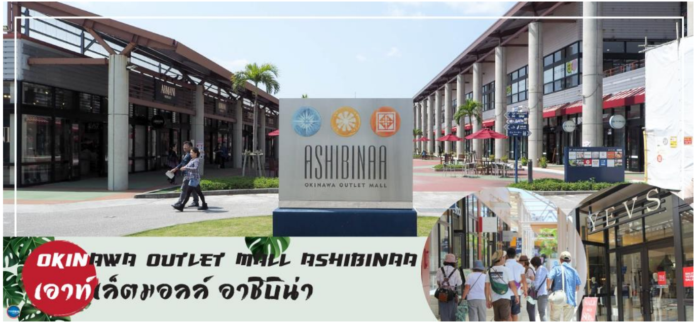
OKINAWA OUTLET MALL ASHIBINAA เอาท์เล็ตมอลล์ อาชิบิโน่า

เช้า รับประทานอาหารเช้า ณ ห้องอาหารของโรงแรม (5) นำท่านเดินทางสู่ ศาลเจ้านะมิโนะอุเอะ (Naminoue Shrine) (ใช้เวลาเดินทางประมาณ 10 นาที) ตั้งอยู่ ณ บริเวณที่เป็นพื้นที่ศักดิ์สิทธิ์ที่ใช้ในการสวดภาวนาอธิษฐานต่อเทพเจ้าที่สถิตย์อยู่ ณ อาณาจักรเจ้าสมุทรโพ้นทะเลมาแต่ครั้งโบราณ ในอดีตชาวเรือที่เข้าออก ณ ท่าเรือนาสะ (Naha Port) ซึ่งขณะนั้นเป็นศูนย์กลางการแลกเปลี่ยนค้าขายกับนานาประเทศ ทั้งจีน ประเทศทางตอนใต้ เกาหลี และชวายามาโตะ มักจะแหงนหน้ามองขึ้นไปยังศาลเจ้าซึ่งตั้งอยู่บนหน้าผาสูงเพื่ออธิษฐาน และแสดงความขอบคุณ ศาลเจ้านามิโนะอุเอะได้รับความเสียหายจากการรบในโอกินาวะ (Battle of Okinawa) เมื่อครั้งสงครามแปซิฟิก แต่ได้รับการบูรณะฟื้นฟูในเวลาต่อมาเมื่อสงครามสิ้นสุดลง ปัจจุบันนี้ได้กลายมาเป็นศูนย์กลางแห่งศาสนาชินโตในจังหวัดโอกินาวะ ชาวญี่ปุ่นมักจะมาไหว้ขอพรเกี่ยวกับธุรกิจการงานให้เจริญรุ่งเรือง ร่ำรวย และมาสะเดาะเคราะห์ให้พ้นโชคร้าย จากนั้นนำท่านสู่ เอาท์เล็ตมอลล์ อาชิบิโน่า (Okinawa Outlet Mall Ashibinaa) (ใช้เวลาเดินทางประมาณ 30 นาที) เอาท์เล็ตแห่งแรกในโอกินาวะ รวบรวมร้านค้าชั้นนำกว่า 100 ร้าน ทั้งเสื้อผ้าแฟชั่น สินค้าแบรนด์เนม นาฬิกา ข้าวของเครื่องใช้ ของเล่น ทุกร้านจัดเต็มทั้งสินค้านำเข้าและรุ่นใหม่ ลดราคากระหน่ำกว่า 30-80% ให้ได้เดินช้อปปิ้งท้ายทวีปกันอย่างจุใจ ภายใต้บรรยากาศสบายๆ สไตล์รีสอร์ทริมทะเล หากช้อปปิ้งจนเหนื่อยสามารถขึ้นไปทานอาหารที่ชั้น 2 มีอีกหลายร้านที่คอยให้บริการ