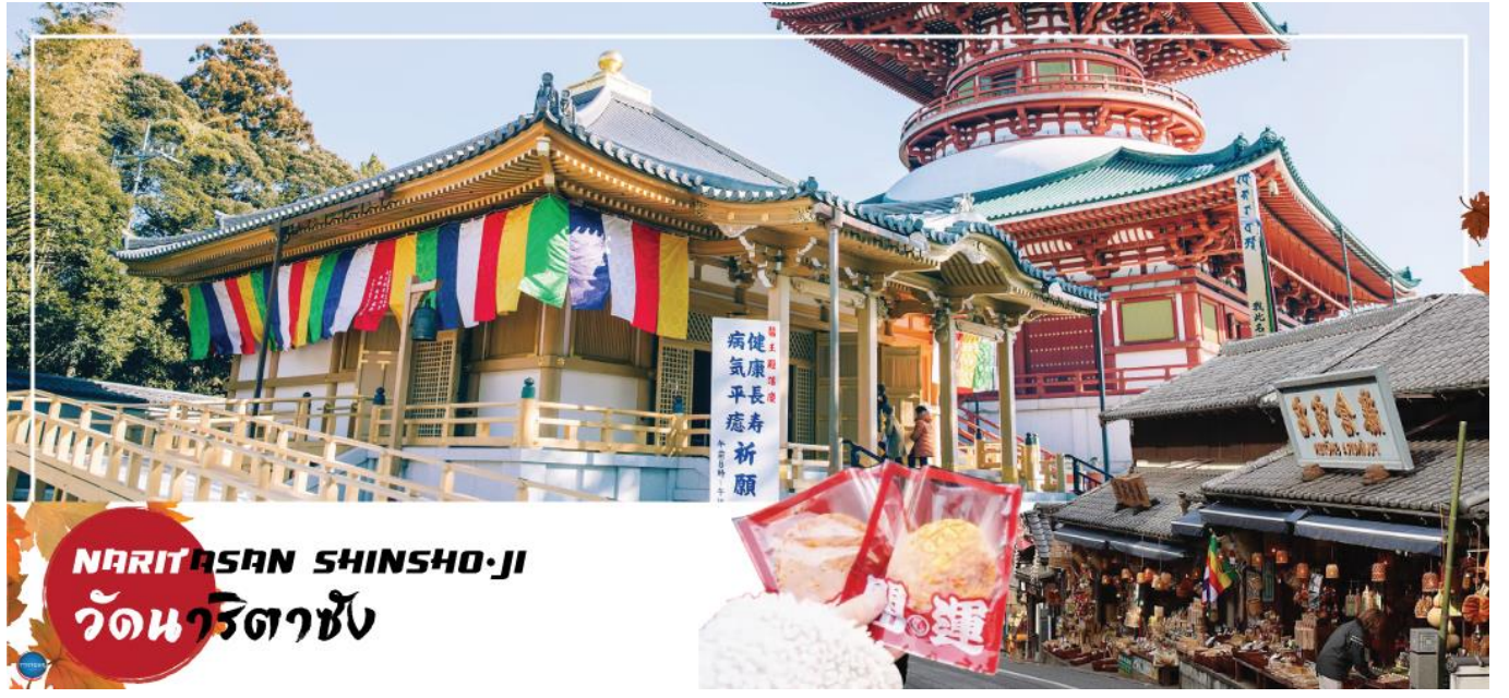
NARITASAN SHINSHO-JI วัดนาริตาชัง

02.30 น. เhierฟ้าสู่ เมืองนาริตะ ประเทศญี่ปุ่น โดยเที่ยวบินที่ XJ602 สายการบิน AIR ASIA X ใช้เครื่อง AIRBUS A330-300 จำนวน 377 ที่นั่ง จัดที่นั่งแบบ 3-3-3 (น้ำหนักกระเป๋า 20 กก./ท่าน หากต้องการซื้อน้ำหนักเพิ่ม ต้องเสียค่าใช้จ่าย)