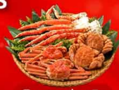
พิเศษ! ว่างปู 3 ชนิด