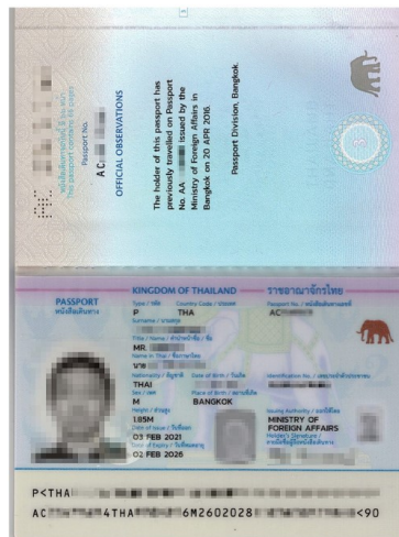
สแกนหน้าพาส ต้องสแกนให้ตรง ต้องเป็นสีเท่านั้น!!